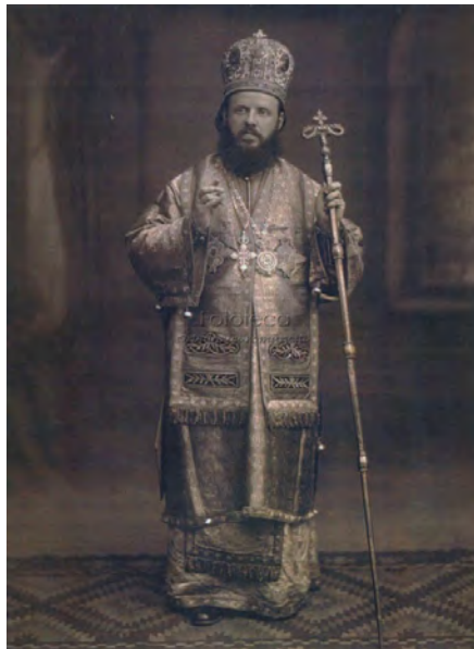
Fig. nr. 3. Revista Arma Cuvântului , a Episcopiei Armatei și Episcopul Dr. †Partenie Ciopron