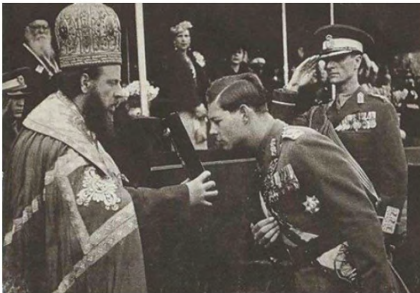
M.S. REGELE MIHAI I ÎNTÂMPINAT DE CĂTRE P.S. PARTENIE, EPISCOPIUL ARMATEI

Fig. nr. 4.