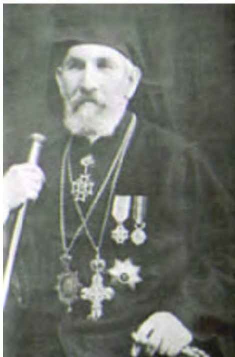
Fig. nr. 2. Episcopul Dr. †Ioan Stroia

Vlădicii Dr. †Ioan Stroia i-a urmat în scaunul de Episcop al Armatei Române, Arhimandritul Dr. Partenie Ciopron , o personalitate emblematică a Bisericii, dar și a Oștirii Române. Viitorul Episcop al Armatei s-a născut la 30 septembrie 1896, în Comuna Păltiniș, jud. Botoșani (fost Dorohoi), primind la botez numele de Ștefan-Petre . La vremea cuvenită, tânărul Ștefan Ciopron , cântăreț bisericesc în strana Mănăstirii Slatina (ctitorie a Domnitorului Alexandru Lăpușeanu, jud. Suceava), la 20 de ani era chemat sub drapel, la oaste, în octombrie 1916, luptând pe front, în primul război mondial; încorporat la 1 noiembrie 1916, făcându-și stagiul militar, până la data de 1 aprilie 1921, mânat de gândul: „ De voi muri pe câmpul de luptă, e o onoare pentru mine, iar aceasta va fi o alegere făcută de Dumnezeu, Care încearcă pe cei care-L Slăvesc ”. În 29 iunie 1917, fiind