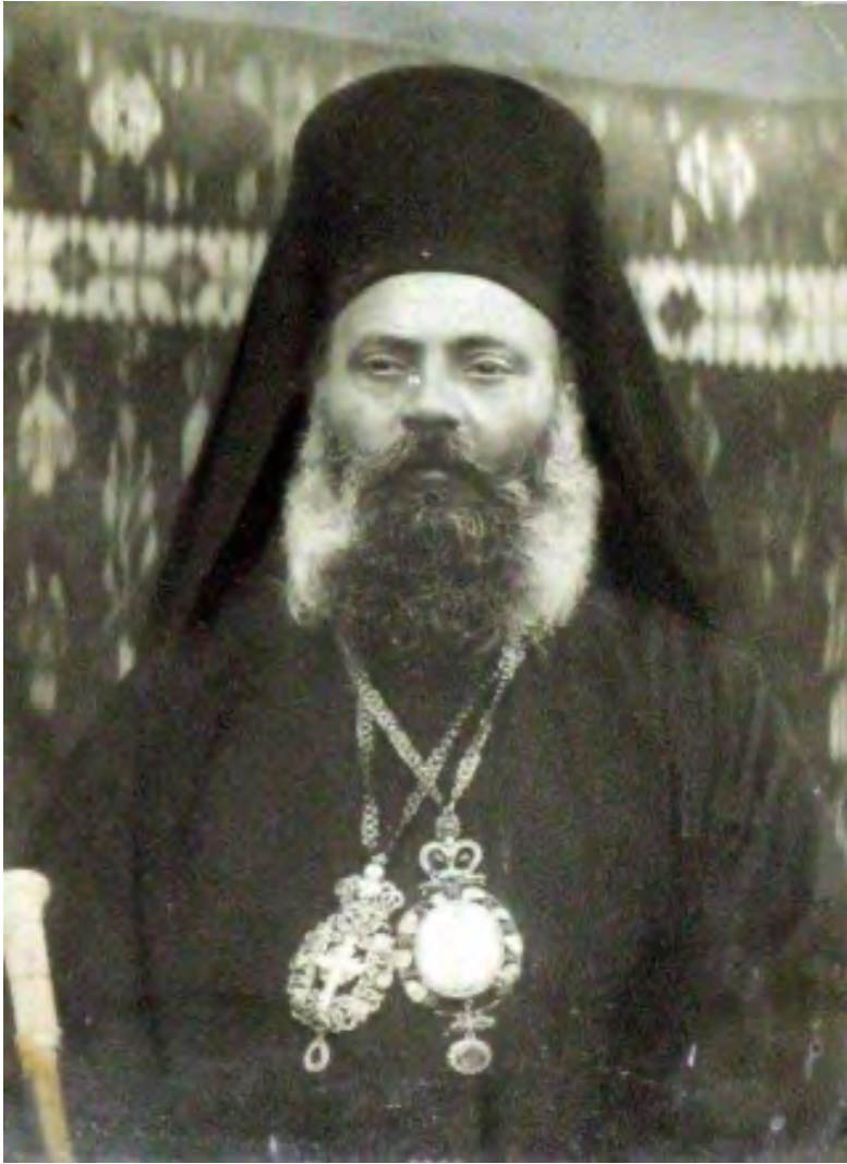
Fig. nr. 2. Episcop †Vartolomeu Stănescu (în Pr. D. Cristescu, Viața și înfăptuirile... , Rm. Vâlcea, 1936).