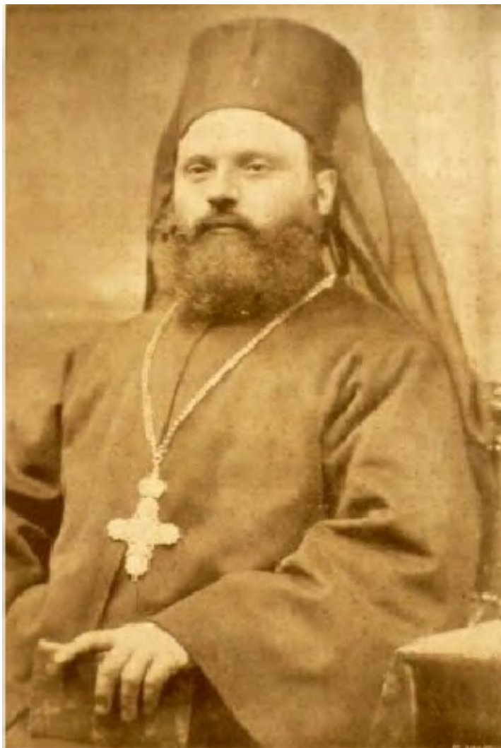
Fig. nr. 1. Vartolomeu Stănescu în perioada studiilor la Paris (în Pr. D. Cristescu, Viața și „Înfăptuirile” Prea Sfințitului Episcop Vartolomeiu până la împlinirea vârstei de 60 de ani , Rm. Vâlcea. Editura Tipografia „Episcopul Vartolomeiu”, 1936, 351 p.)