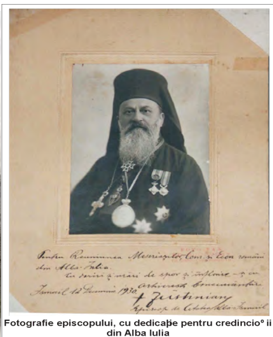
Fotografie episcopului, cu dedicație pentru credincioșii din Alba Iulia