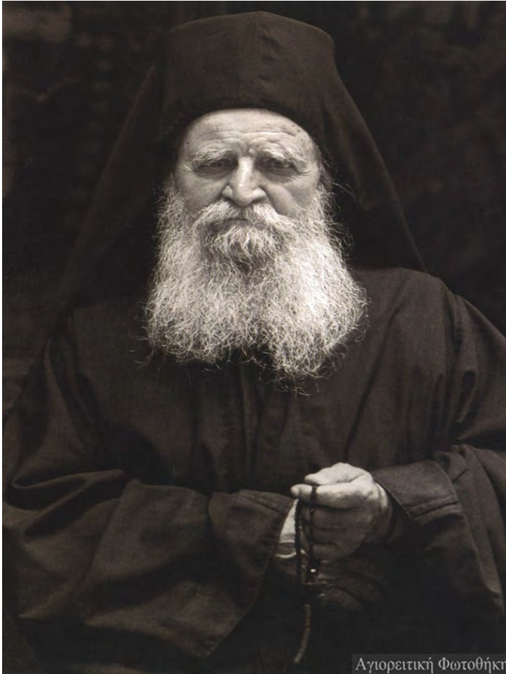
Fig. nr. 1. Episcopul Vartolomeu Stănescu