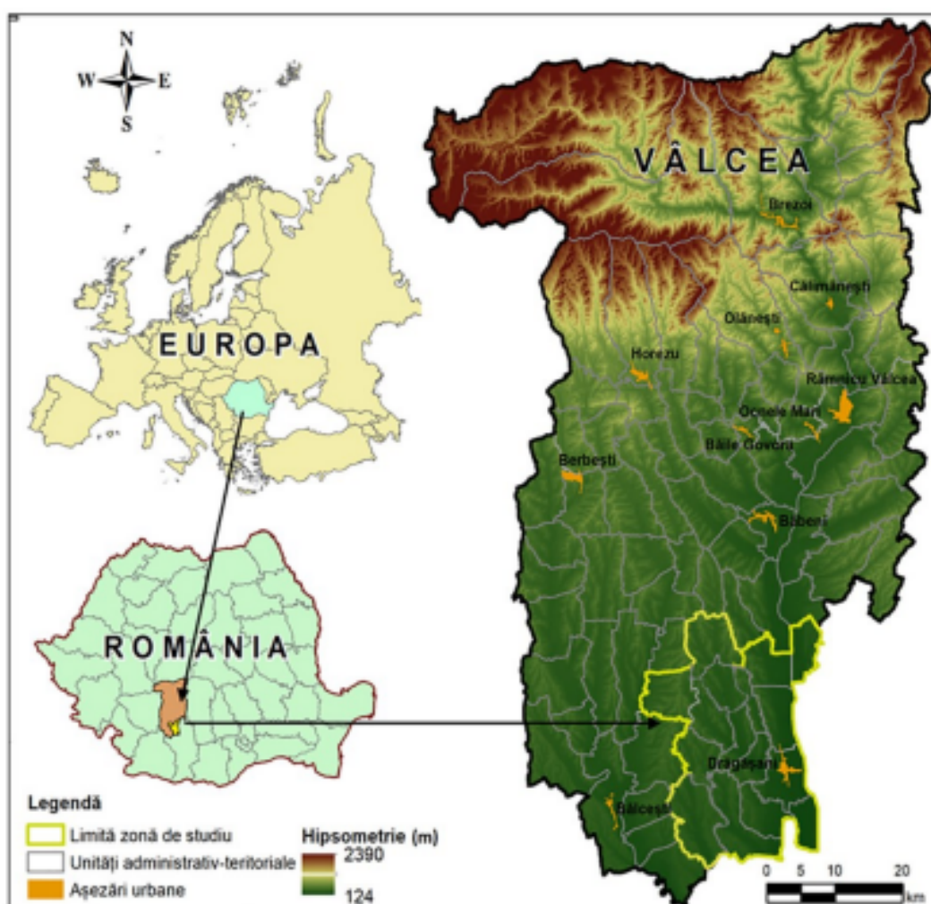
Fig. 1. Localizarea arealului de studiu

Geografic, arealul studiat este situat aproximativ între paralele de 44°51' și 44°32' latitudine nordică și meridianele de 23°59' și 24°19' longitudine estică. În acest spațiu, cu o suprafață de cca. 60.000 ha, sunt cuprinse porțiuni din sudul Podișului Getic și din Culoarul Oltului.