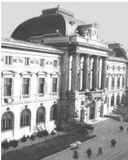
Fig. 1 Banca Națională a României (1890-1938)