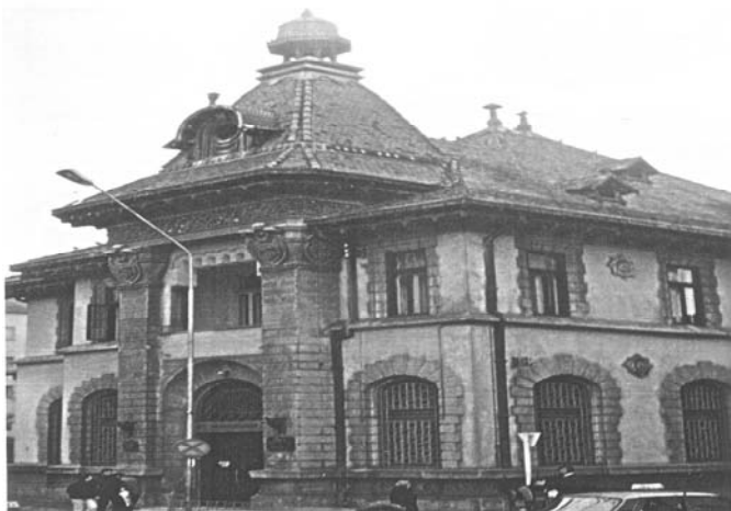
Fig. 14. Banca Vâlcea (1927-1943)