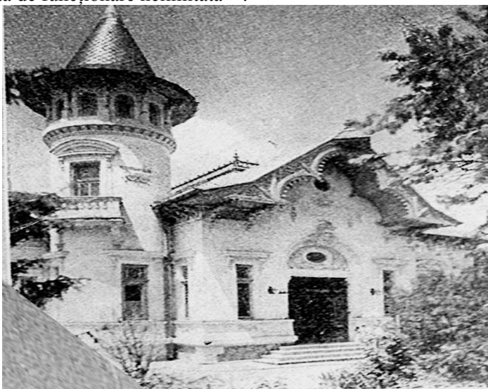
Fig. 13. Banca Calafatului

La 14 aprilie 1903, acționarii societății de credit, convocați în adunare generală extraordinară și reprezentând întregul capital social, au hotărât transformarea acesteia din societate cooperativă de credit în societate anonimă pe acțiuni, sub denumirea de Banca Calafatului 442 . Instituția își începea activitatea la 10 octombrie 1903, cu un capital social de 300.000 de lei împărțit în 3.000 de acțiuni a câte 100 de lei fiecare 443 . Sediul era stabilit în str. Argetoianu, iar durata de funcționare nelimitată 444 .