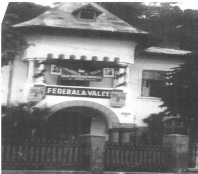
Fig. 19. Banca Federală Cozia, Rm Vâlcea