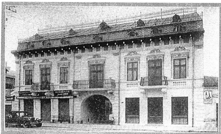
Fig. 9. Agenția Băncii Comerțului din Balș

Agenția Drăgășani și-a început activitatea la 9 mai 1912, prin preluarea activului și pasivului societății cooperative Unirea Comercială Drăgășani 373 . Agenția a avut două sedii în localitate: unul în str. Voievodul Mihai, nr. 12 și altul în str. Al. Lahovary, nr. 10.