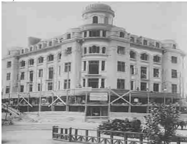
Fig. 18. Banca de Scont Sucursala Craiova

Sgarbură. Cu ajutorul creditelor obținute de la această bancă, locuitorii județului au reușit să-și refacă gospodăriile distruse în timpul primului război mondial 692 . Sucursala din Craiova a fost înființată în anul 1913, iar primele operațiuni contabile au fost înregistrate la 7 mai 1914 693 . Fondatori au fost Banca de Scont București și 14 cetățeni din localitate. Sediul sucursalei a fost în str. Ed. Quinet, nr. 11.