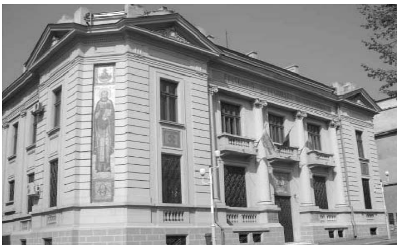
Fig. 3. Agenția Băncii Naționale a României din Turnu Severin (1929-2000)