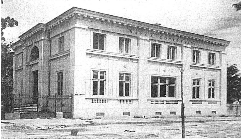
Fig. 8. Agenția Băncii Comerțului din Turnu Severin

Agenția Turnu Severin a fost înființată la 1 iulie 1911, iar primele operațiuni bancare le-a desfășurat la 1 august același an. Societatea a fost înscrisă la Tribunalul Mehedinți sub nr. 560 din 8 august 1911. Imobilul agenției a fost în B-dul Carol, nr. 23 369 . Acesta era compus din parter și etaj, parterul servind pentru operațiuni de bancă, iar etajul ca locuință destinată directorului 370 .