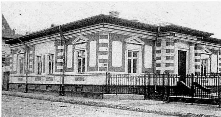
Fig. 10. Agenția Băncii Comerțului din Drăgășani (str. Voievodul Mihai, nr. 12)

Agenția Drăgășani și-a început activitatea la 9 mai 1912, prin preluarea activului și pasivului societății cooperative Unirea Comercială Drăgășani 373 . Agenția a avut două sedii în localitate: unul în str. Voievodul Mihai, nr. 12 și altul în str. Al. Lahovary, nr. 10.