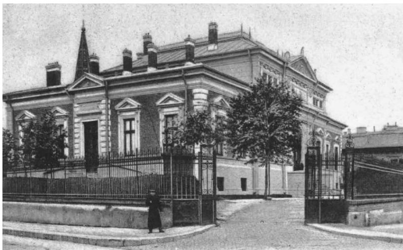
Fig. 2. Banca Națională a României Sucursala Craiova (1890-2009)