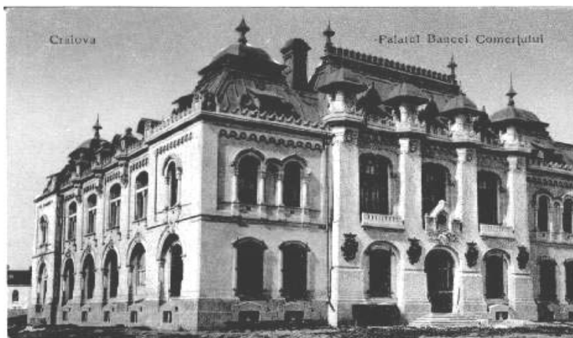
Fig. 12. Palatul Băncii Comerțului Craiova (1915- 1949) – astăzi Palatul Primăriei