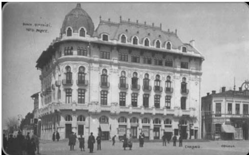
Fig. 14. Banca Olteniei și „Hotelul Palace”