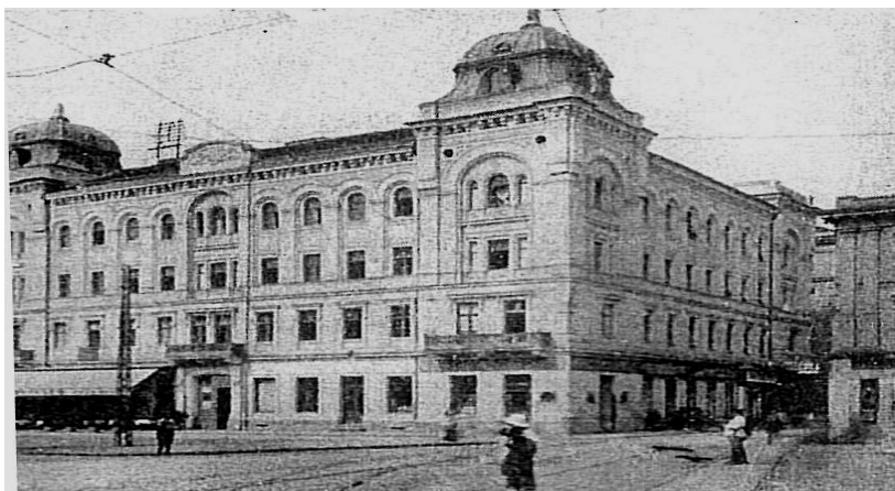
Fig. 11. Prima Casă de Păstrare din Timișoara

capital social de 200.000 de lei, punând bazele Băncii Drăgășani din județul Vâlcea. La subscrierea capitalului a participat și Banca Comerțului 381 . Alte bănci afiliate au fost: Prima Casă de Păstrare din Timișoara, fondată în anul 1845, pentru comerț de bancă; Cassa de Păstrare S.P.A. Petroșani, înființată în anul 1901, având ca activitate comerțul de bancă 382 .