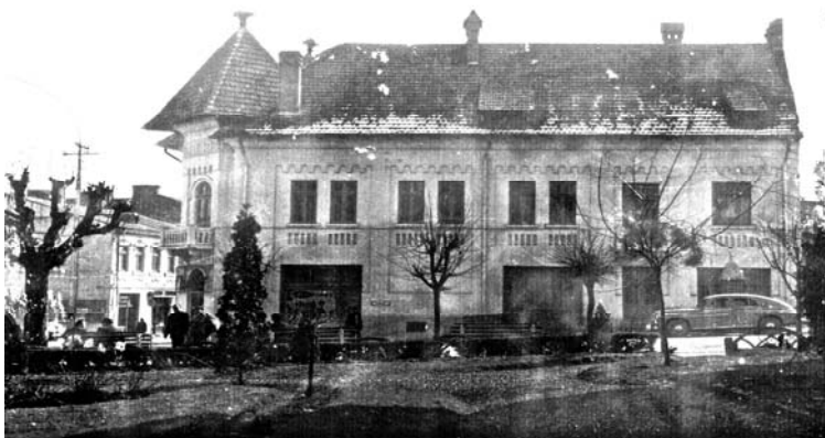
Fig. 15. Banca Râmnicului (1905-1948)

Având ca obiect social comerțul bancar 484 , Banca Râmnicului s-a remarcat prin activitatea desfășurată în județul Vâlcea. Aceasta a fost înființată la 16 mai 1905, din îndemnul lui I. G. Duca 485 și a fost admisă la cont curent, de Agenția Băncii Naționale din localitate, la 19 ianuarie 1906. Forma organizatorică a fost aceea a unei societăți anonime pe acțiuni nominative, cu durată nelimitată, iar sediul principal s-a aflat în str. Traian, nr. 125 486 .