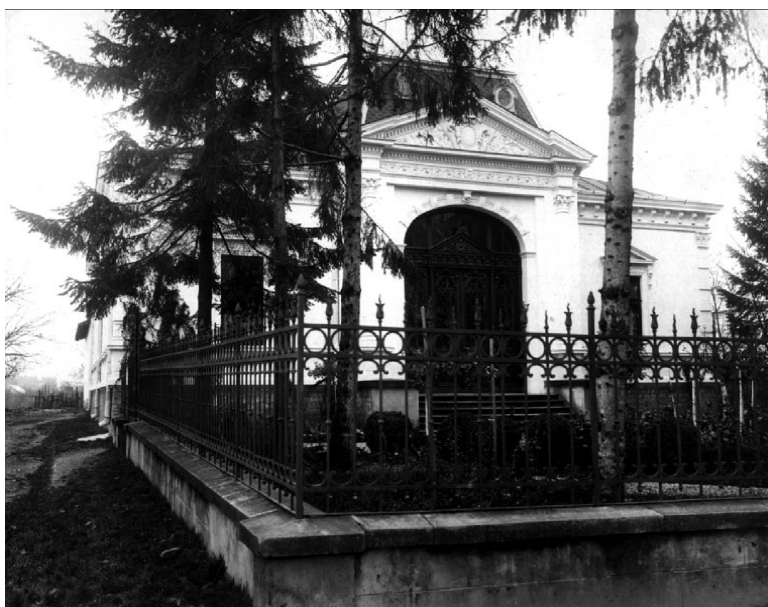
Fig. 4. Banca Națională a României Agenția Tg. Jiu

Agenția Tg. Jiu a Băncii Naționale a fost înființată la 15 aprilie 1899. De la data înființării agenției și până la 1900, aceasta a funcționat într-un imobil închiriat. În anul 1901, Guvernatorul M. Soutzu l-a însărcinat pe D. I. Dimitriu să achiziționeze, de la fostul prefect Ion Carabatescu, „casele sale din str. Griviței, nr. 7”, cu anexele destinate servitorilor 314 . Pentru a putea servi drept sediu de bancă, imobilul a suportat modificări în timp, cele mai importante fiind: amenajarea tezaurului (1902) și alimentarea cu energie electrică (1907).