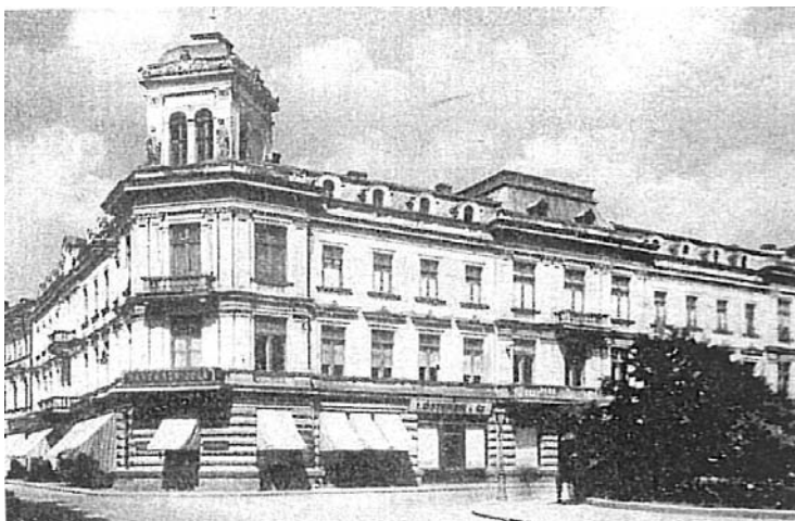
Fig. 16. Imobilul Băncii Comerțului din București

Pentru a satisface nevoile clientelei, băncile și-au dezvoltat și după război rețeaua de sucursale și agenții. În anul 1918 și-au reluat activitatea agențiile Băncii Comerțului, din localitățile: Balș, Caracal, Corabia, Drăgășani, Tg. Jiu și Turnu Severin. În ianuarie 1921, adunarea generală a acestei bănci a decis înființarea agenției de la Lugoj și a sucursalei din București 606 . În același an, la 30 iunie, ea a preluat, prin fuziune, întreg activul și pasivul Băncii Jiul din Bechet, societate anonimă pentru comerțul de bancă 607 .