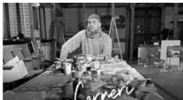
SHOWROOM MARINER Timișoara - Divizia 9 Cavalerie 64