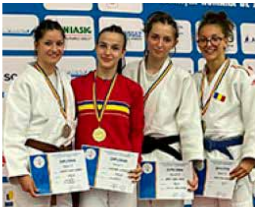
Național Juniori 3, U16, individual și Campionatul Național Echipe juniori 2, U 18, masculin și feminin.

Urmează la sfârșitul lunii mai Campionatul