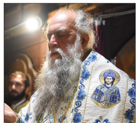
■ Material realizat cu sprijinul Arhiepiscopiei Râmnicului

Beneficii: salariu conform schemei de funcții și personal ale instituției; program 8 ore/zi, de luni până vineri; liber în zilele de sărbători legale și sărbători religioase. Pentru informații suplimentare număr de telefon: 0752.244.344 (de luni până vineri, în intervalul orar 08.00-16.00). CV-urile se depun la adresa de email costeadaniel2403@gmail.com până la data de 31 octombrie 2022.